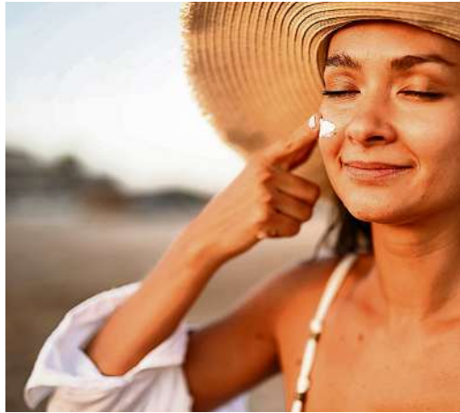
Wie man die Haut richtig schützt.