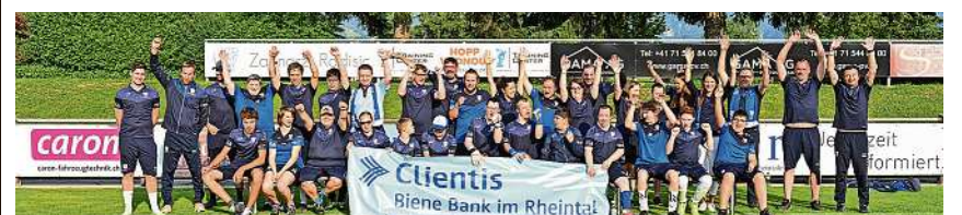
Das Team Plus, das OK und die Sponsoren freuen sich auf das 1. Biene Fussballturnier PLUS in Widnau.