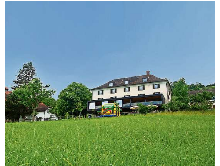
Seit Januar 2020 ist die Malia Stiftung Mieterin des Gutshof Forst in Altstätten.

Auch gastronomisch lässt das Fest keine Wünsche of-